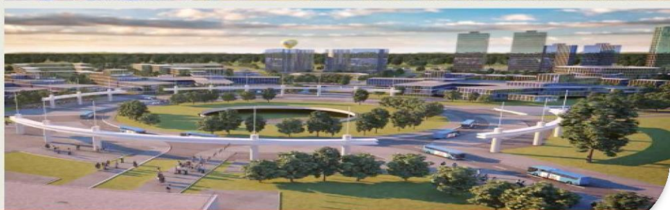
ВИЗУАЛИЗАЦИЯ ПРОЕКТИРУЕМОЙ ТЕРРИТОРИИ